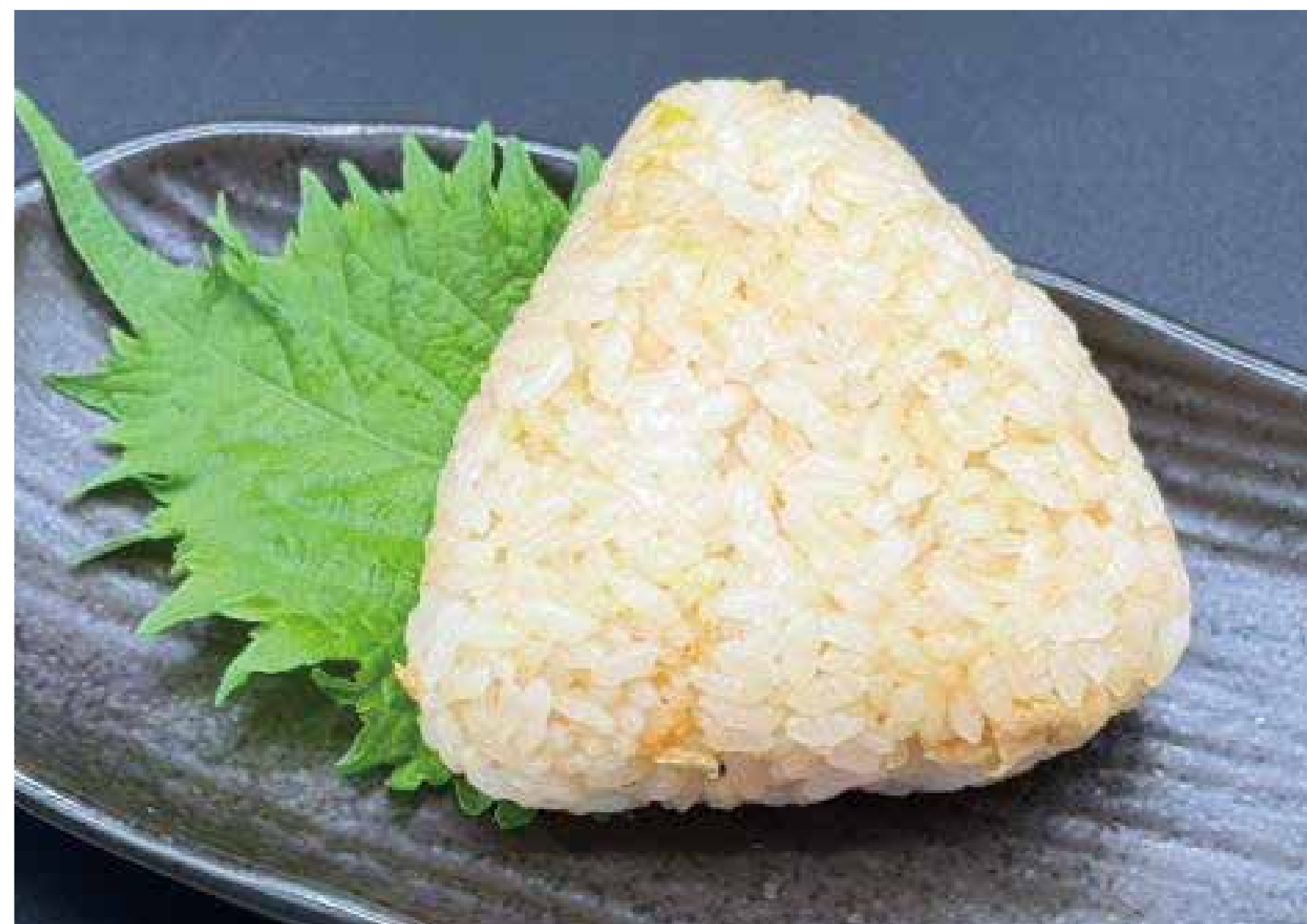
そら豆と 桜エビの 炊き込みおにぎり 200円 (220円税込)