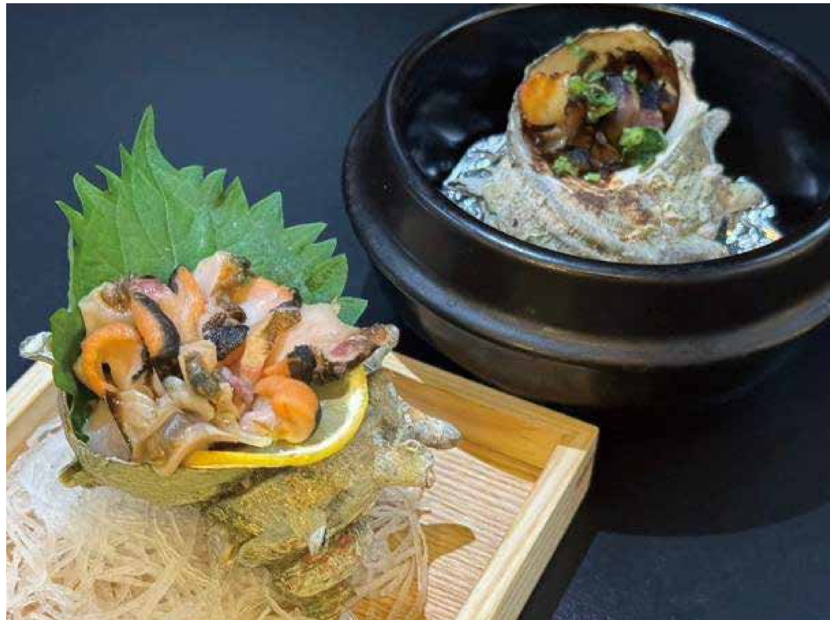
活きサザエ (壺焼き、刺身) 760円 (836円税込)