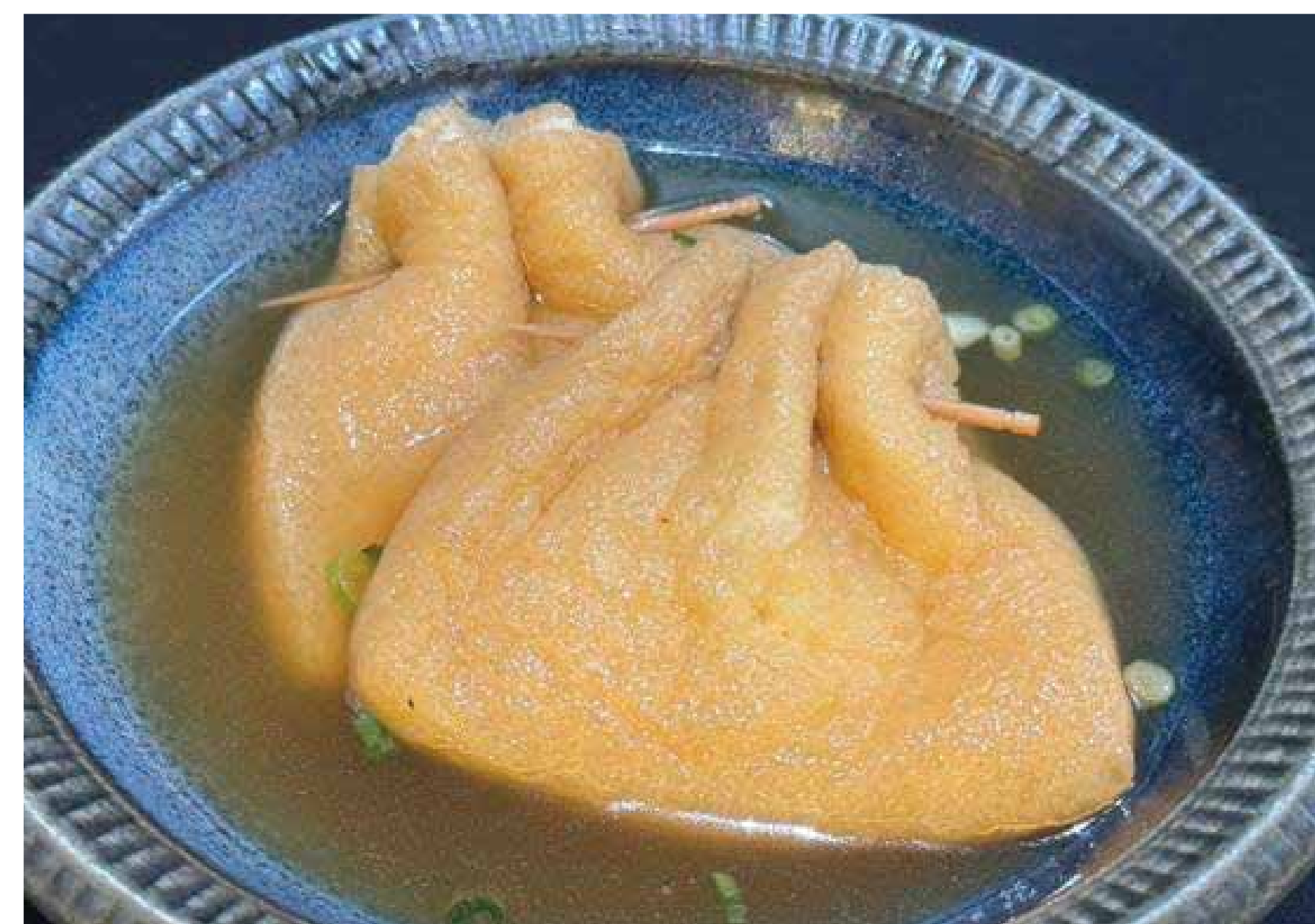
出汁染み 餅巾着 350円 (385円税込)