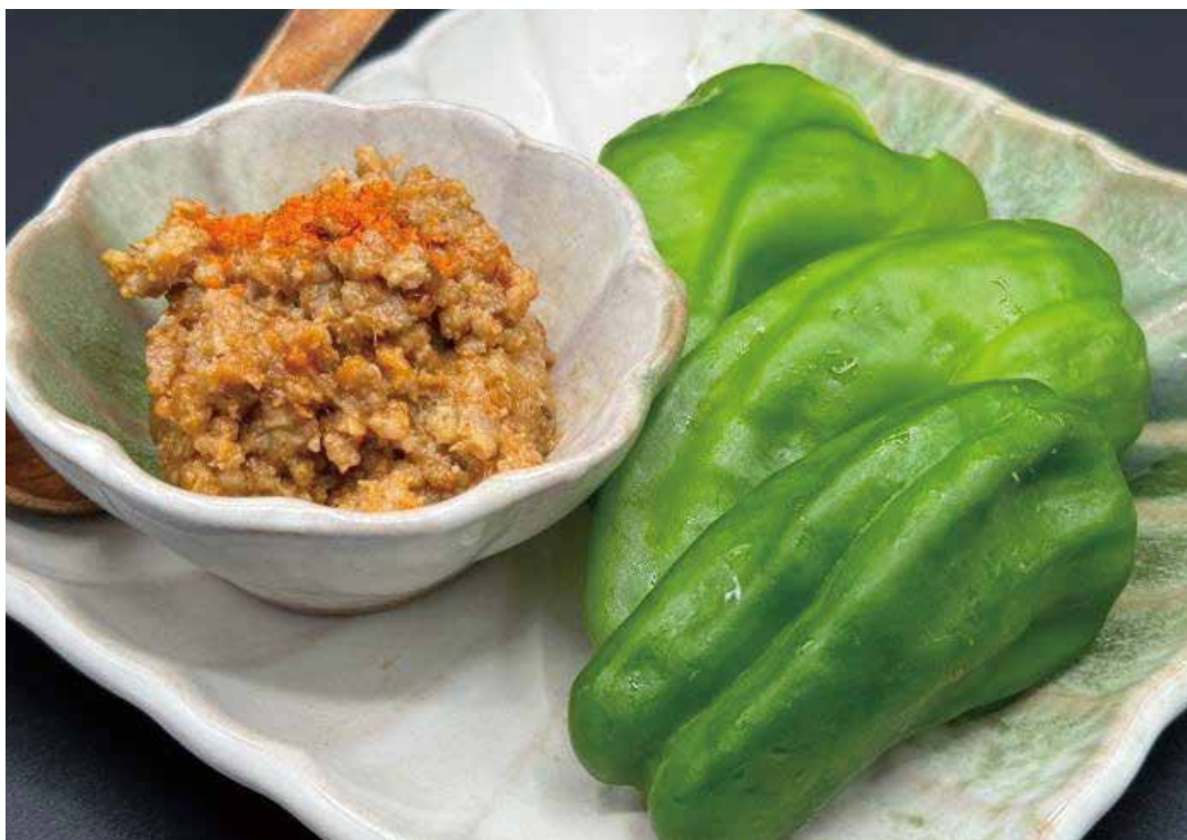
パリパリ 肉味噌ピーマン 400円 (440円税込)