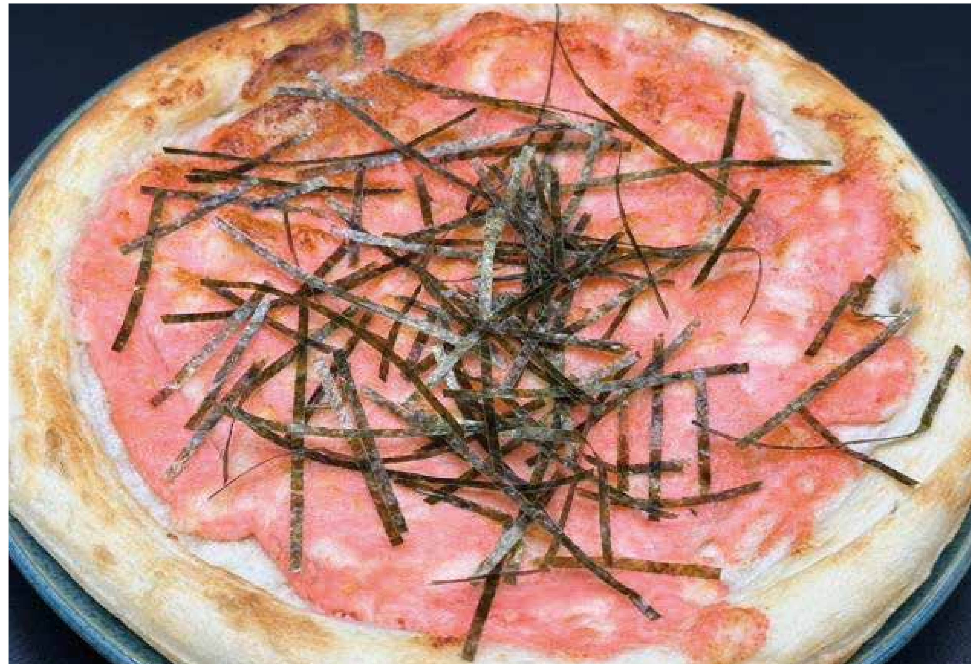
明太餅 チーズピザ 1180円 (1298円税込)