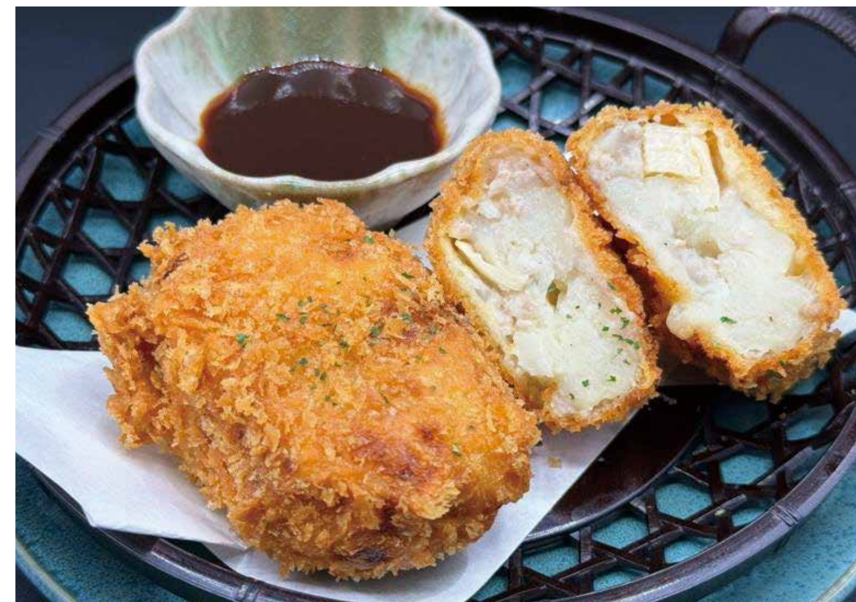
筍と新じゃがの コロツケ 550円 (605円税込)