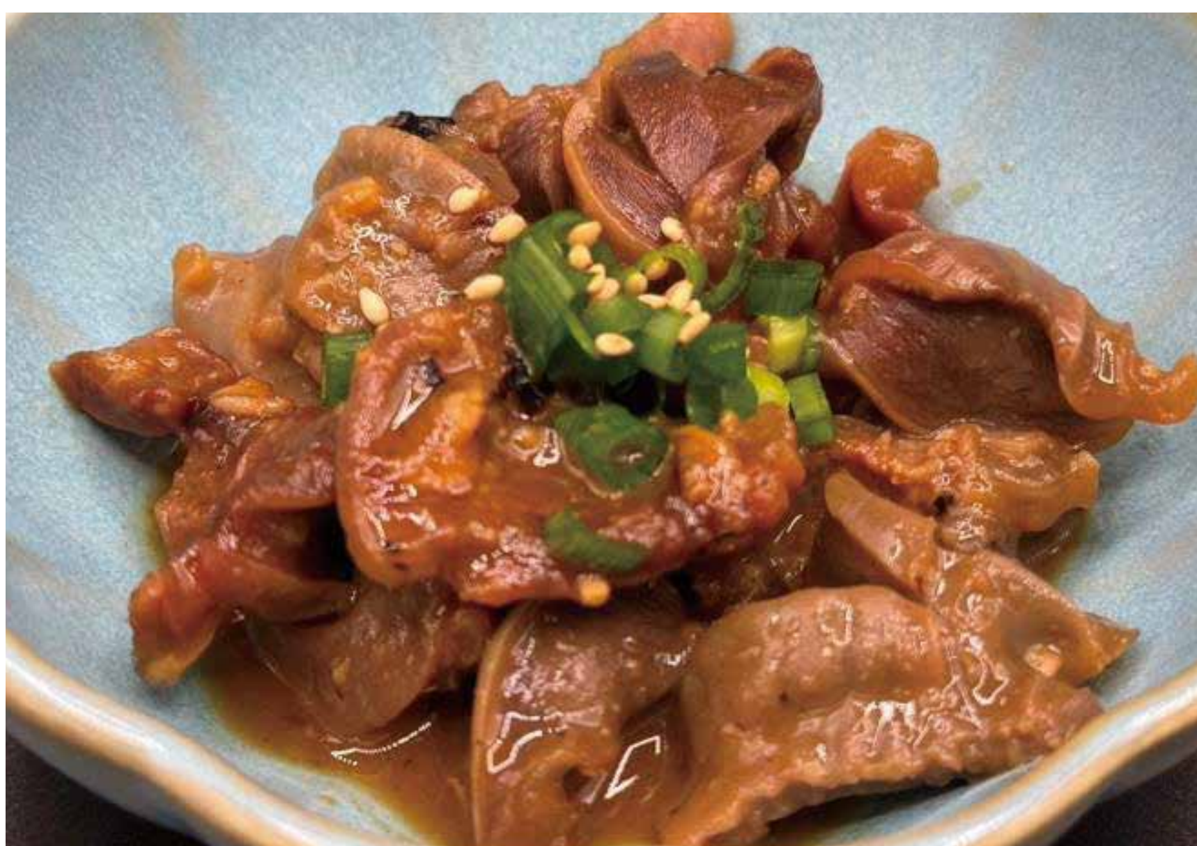
砂ずり 味噌煮込み 580円 (638円税込)