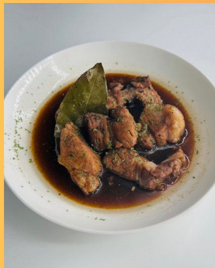
スペアリブの 赤ワイン煮込み ¥880円 (税込968円)