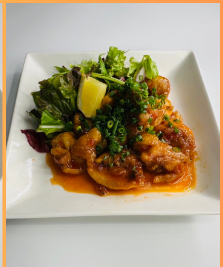
鶏肉の甘辛 チリソース炒め ¥780円 (税込858円)