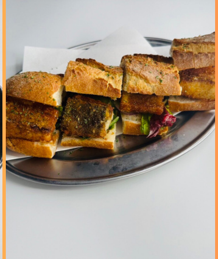
長崎名物 カツサンド ¥680円 (税込748円)