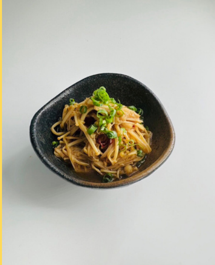
やみつきえのきの 焼き浸し ¥380円 (税込418円)