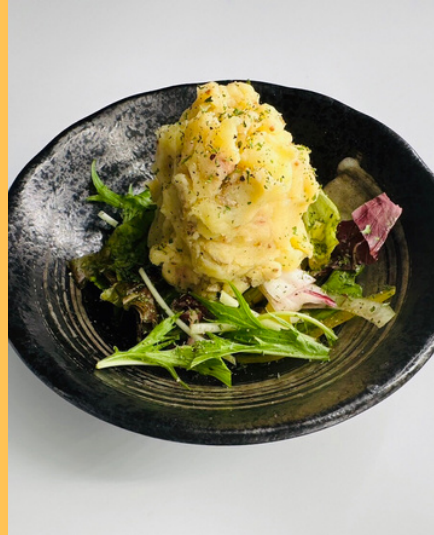
ジャーマン風 ポテトサラダ ¥480円 (税込528円)