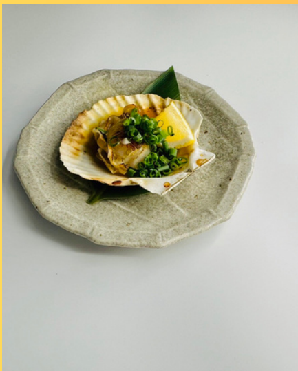
殻付き帆立の バター醤油焼き ¥350円 (税込385円)