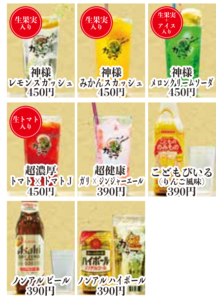
生果実入り 神様レモンスカッシュ 450円 生果実入り 神様みかんスカッシュ 450円 生果実入り 神様メロシカリームソーダ 450円