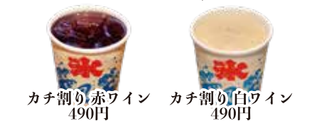
カチ割り赤ワイン 490円 カチ割り白ワイン 490円