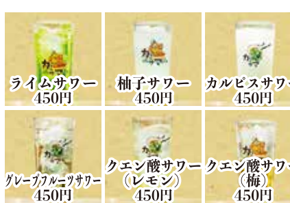
ライムサワー 450円 柚子サワー 450円 カルピスサワー 450円