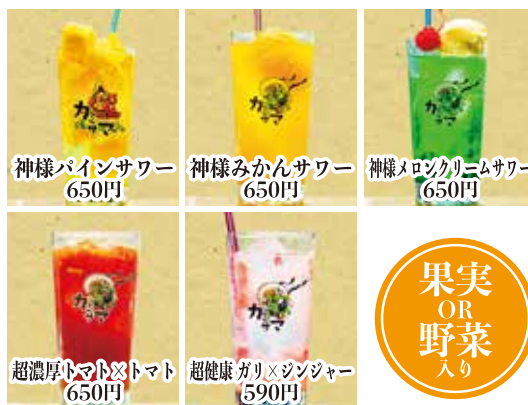
神様パイナップルサワー 650円 神様みかんサワー 650円 神様メロシカリームサワー 650円