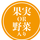
超濃厚トマト×トマト 650円 超健康ガリ×ジンジャー 590円