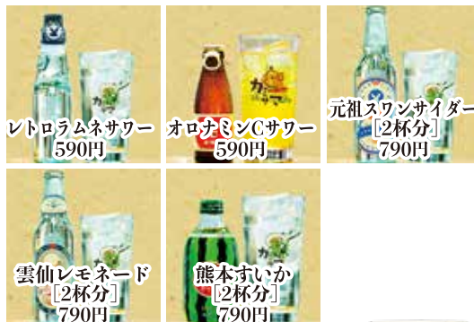
レトロラムネサワー 590円 オロナミンCサワー 590円 元祖スワンサイダー [2杯分] 790円