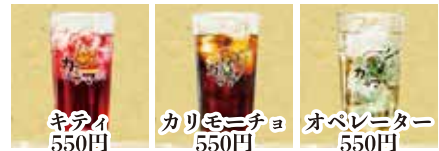
キタイ 550円 カリモニチヨ 550円 オベレニター 550円