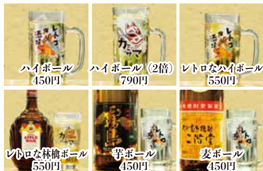
ハイボール 450円 ハイボール(2倍) 790円 レトロなハイボール 550円