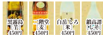
黒霧島 [芋] 450円 三階堂 [麦] 450円 白岳しる [米] 450円 鍛高譚 [しぼ] 450円