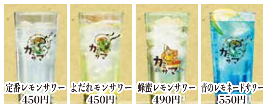
定番レモンサワー 450円 よだれレモンサワー 450円 蜂蜜レモンサワー 490円 青のレモネードサワー 550円