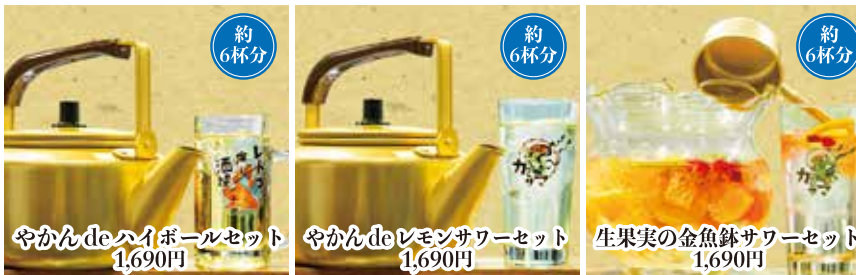
やかんdeハイボールセット 約6杯分 1,690円 やかんdeレモンサワーセット 約6杯分 1,690円 生果実の金魚鉢サワーセット 約6杯分 1,690円