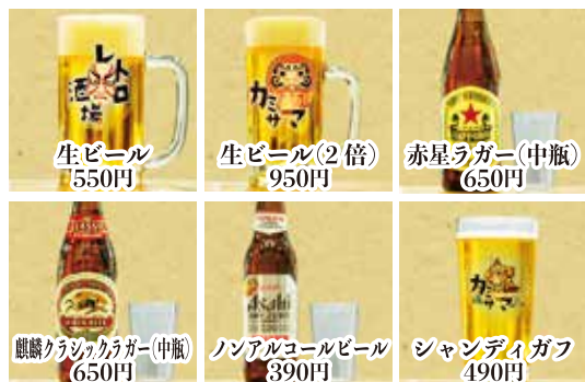
生ビール 550円 生ビール(2倍) 950円 赤星ラガー(中瓶) 650円