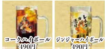
コークハイボール 490円 ジンジャーハイボール 490円