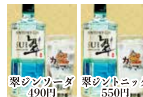
翠ジンソーダ 490円 翠ジントニック 550円